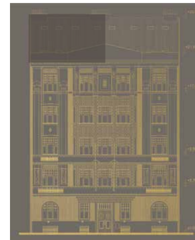
Pohled na dům